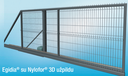
Egidia® su Nylofor® 3D užpildu