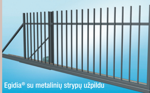
Egidia® su metalinių strypų užpildu

Vartai Egidia® – tai idealus sprendimas privatiems namams, parkams, pramoninės paskirties objektams, sandėliams ir firmoms.