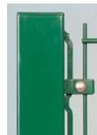
Tvoros tvirtinimo juosta