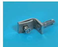
Tvoros tvirtinimo sąvarža