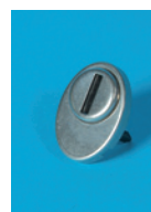
Užrakto apsauga nuo dulkių